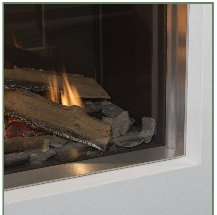
Abbildung 3 - Beispiel Edelstahlverkleidung