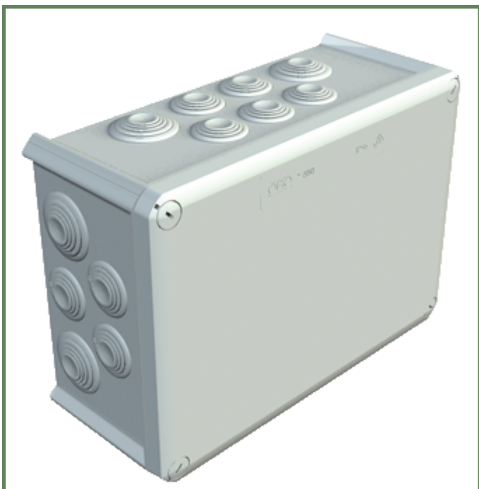
Abbildung 2 - Montagekasten